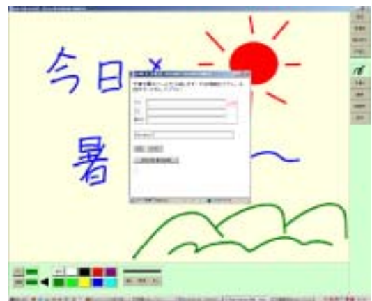
図4 手書きメッセージ送信設定中の画面