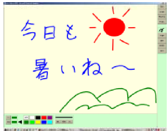
図3 手書きメッセージ作成中の画面

今後の課題としては、考察に示した改良を行い、汎用性を高めることに加え、送られてきたメッセージにさらに手書きメッセージを上書きし、返信を行える仕組みを加えることが挙げられる．