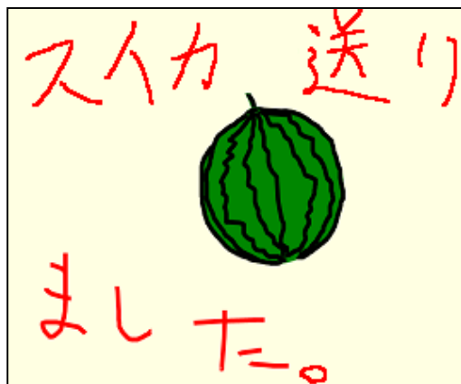
図1 手書きメッセージの例

手書き電子メールの特徴は、手書きで書いたメッセージを電子メールとして送受信できる点である(図1)。手書きの文字の他に図形や絵をそのまま送ることもでき、電子メールの表現力が豊かになる。また、キーボードの操作に慣れていない人でも手書きでメッセージを作成できるため、キーボードの扱いになれていない初心者でも利用できる。さらに、キーボードが利用できない機器や場面でも、電子メールを利用することができる。